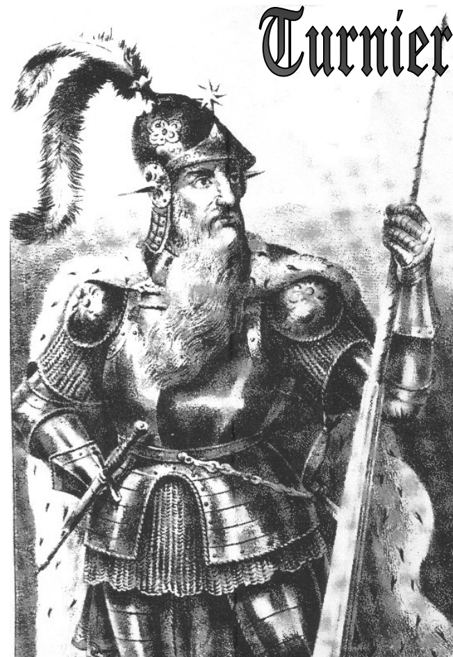
Herzog Otto von Braunschweig zu Göttingen